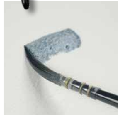
hohe Farbaufnahme high colour absorbing capacity