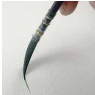
feinste und stabile Spitze finest and stable point