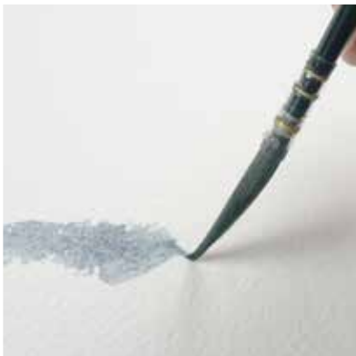
hohe Elastizität high elasticity