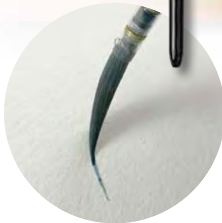
Feinste und stabile Spitze Finest and stable point