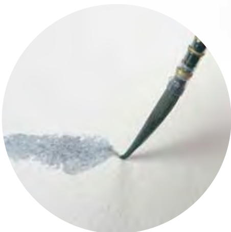
Hohe Elastizität Top elasticity