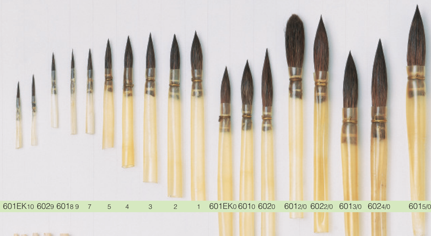
601EK10 6029 60189 7 5 4 3 2 1 601EK0 6010 6020 6012/0 6022/0 6013/0 6024/0 6015/0