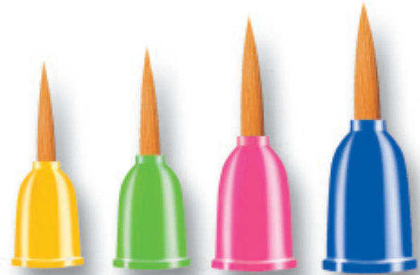
5090-S Ø 10,6 mm 5090-M Ø 12 mm 5090-L Ø 14 mm 5090-XL Ø 16 mm

No. de commande 5089 4 tailles S 2 tailles M - L - XL per en TAG-BAG quantité idéale pour les anniversaires d'enfants ou les groupes de thérapie