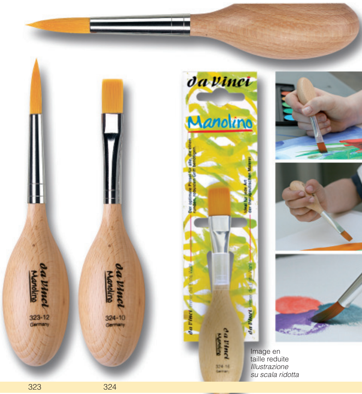
Image en taille reduite Illustrazione su scala ridotta