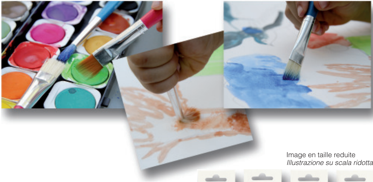
Image en taille reduite Illustrazione su scala ridotta

SETOLA BIANCA CON MANICO BLU Codice art. 5337B – 24 x 358B, tondo Codice art. 5338B – 18 x 359B, piatto