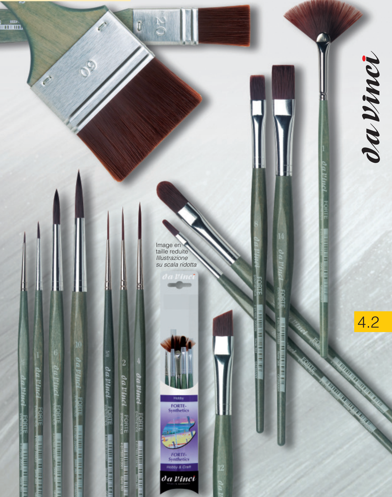
Image en taille reduite Illustrazione su scala ridotta